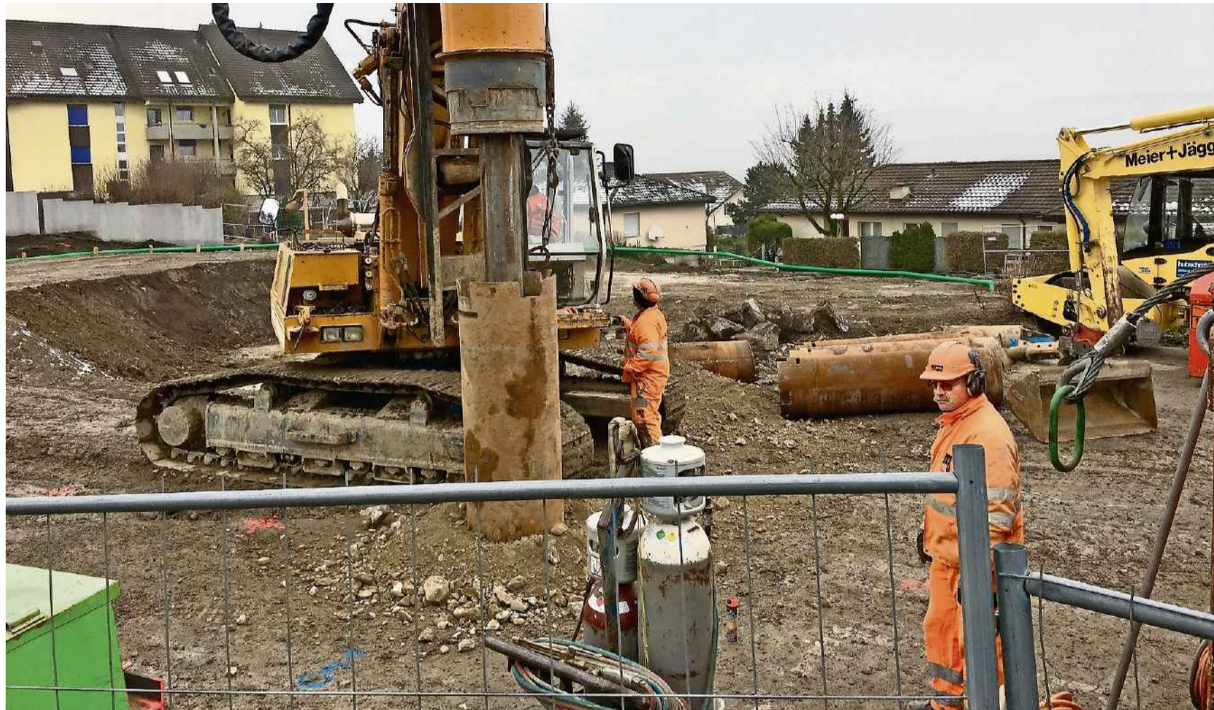
Auf dem Areal des ehemaligen «Kellerämterhofs» in Oberlunkhofen wird der Baugrubenabschluss erstellt, wofür 78 Bohrungen notwendig sind.